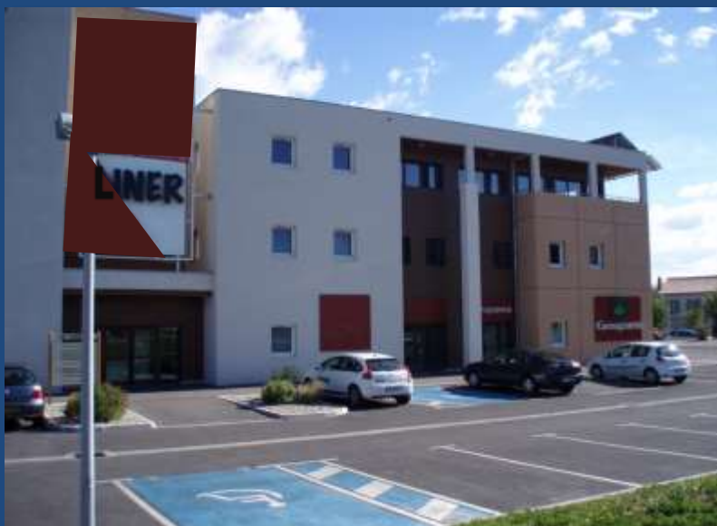
Immeuble Le Liner Voir plan d'accès (au verso)